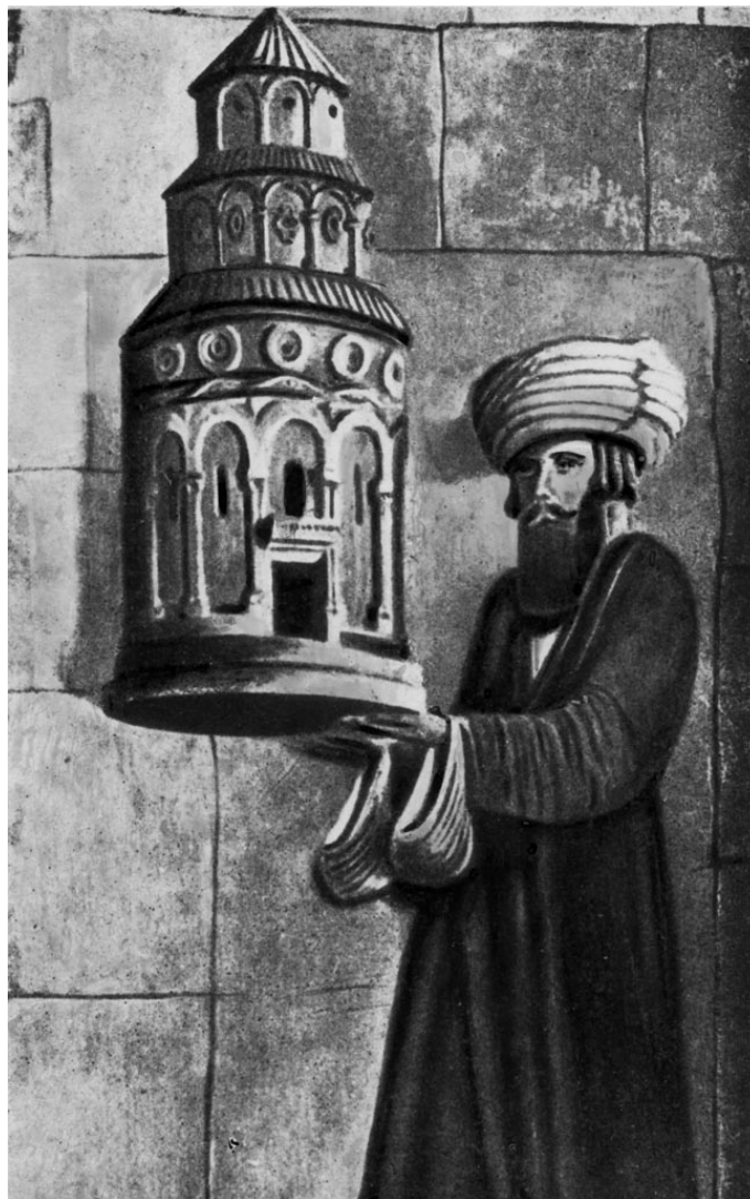
Նկ. 1 – Գաղկաշենի մոդելը և Գաղիկ I արքան: