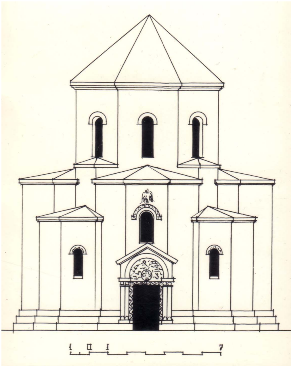
Գծ. 2 – Չախնուսի եկեղեցու ճակատ (վերակազմություն՝ Տ. Մարությանի):