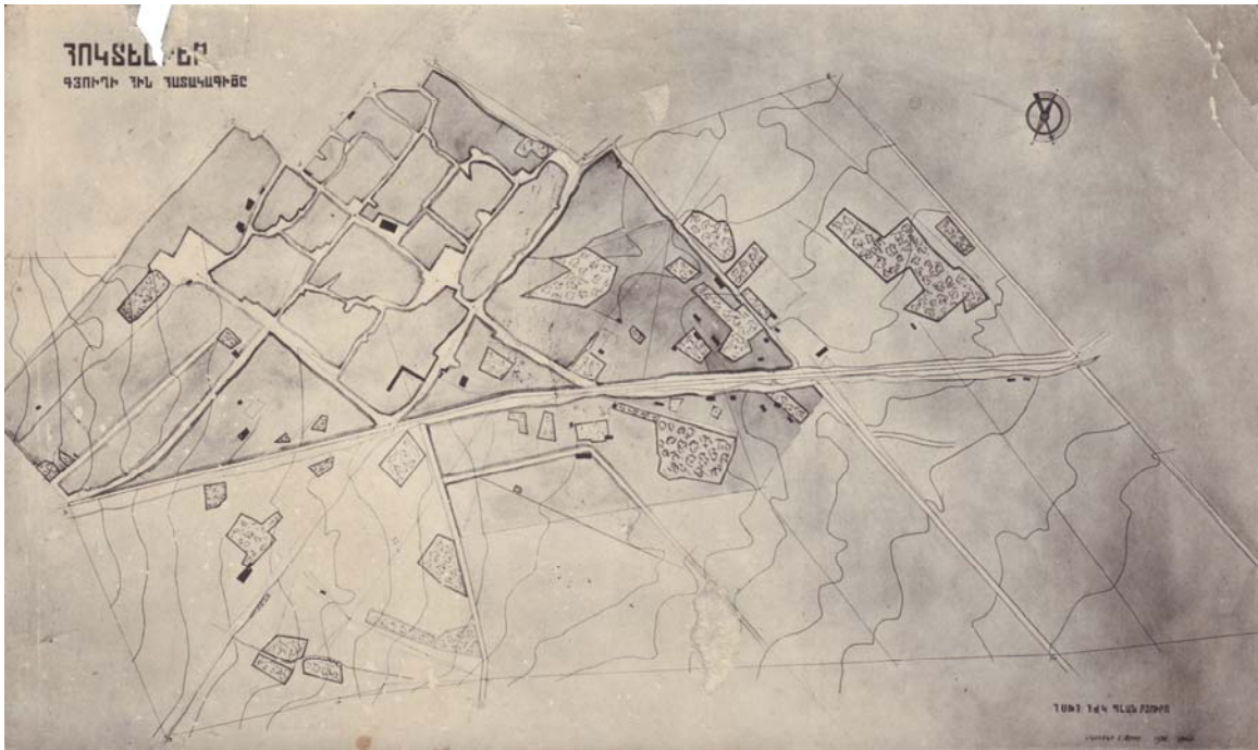
Գծ. 1 – Մարդարապատ գյուղի հին հատակագիծը: