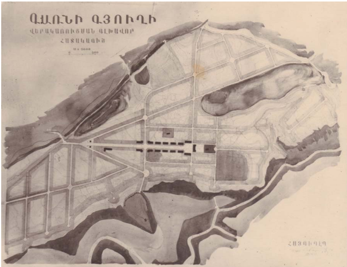
ՊՃ. 3 – Գառնի գյուղի հատակագիծը, 1954 թ.:

Ամեն կարգի տուրիստներ Գառնիի հուշարձանը այցելելիս, անցնում են փողոցներով, ականատես նրա մաքուր, կանաչավետ իրավիճակին: Պետք է ափսոսալ միայն, որ հատակագծով նախատեսված ավանի մուտքից հուշարձան տանող հատուկ ճառագայթաձև փողոցը թողնվել է մասամբ անավարտ: