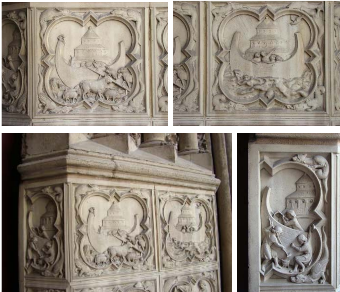
Նկ. 2, 3, 4, 5 – Հարթաքանդակների ժամանակակից լուսանկարներ:

Սա այն կարևորն է, որը պետք է նկատի ունենան Զվարթնոցի վերակազմության Թրոմանյանի նախագծի ճշտության վիճարկողները: