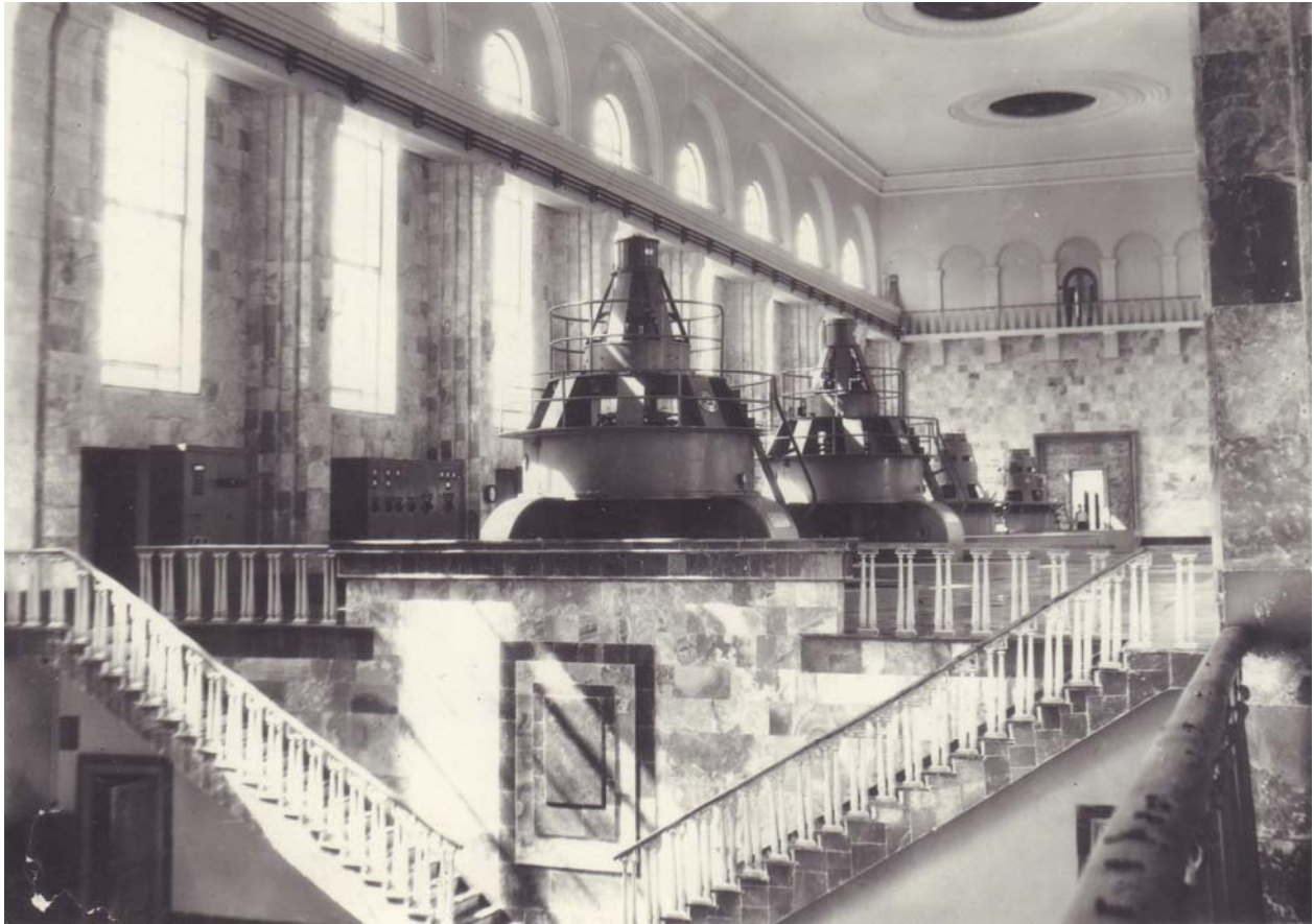
Նկ. 7 – Արգել ՀԷԿ-ի ինտերիերը (ճարտ.՝ Ս. Մարության)

Աթարբեկյան հէկ-ում [այժմ՝ Հրազդանի հէկ] ինձ մոտ թողին միայն արտաքինին: Ճակատը մշակելիս ինստիտուտի տնօրենը և մի քանի հոգի փորձեցին ինձ գրկել իմ դերից, հայտարարեցին մրցույթ իմ, իմ օգնական Ալիկի և նոր ընդունված Էդիկ Զաքոյանի միջև: Արդյունքում իմ օգնական Ալիկը անկեղծորեն ասաց. «Ես քո հին էսքիզներից կրկնել եմ, ի՞նչ էիր կարծում ի՞նչ կարող էի անել», Էդիկը չեմ հիշում ինչ էր արել, ես իմ բոլոր էսքիզների կրկնություններն էի բերել, որ ցույց տայի, որ նրանք միայն կրկնել կարող են: Իմ արածը, որ վատ չէր, Արմո Գեղամիչը, տարավ Մամվել Սաֆարյանի մոտ, նա հավանություն տվեց, նոր միայն ընդունեցին [...], տարան նաև Ասցատրյանին (Կենտկոմի արդյունաբերության բաժնի վարիչ), նա թե «Դուք այնքան լավ նախագծեր էք անում, որ մեզ հետ համաձայնեցնելու կարիք չկա», ասեց իմ տնօրենին,