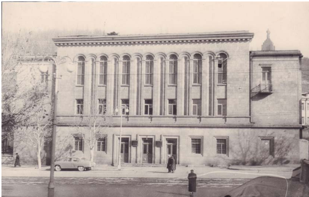
Նկ. 2 – Երևանի կոոպերատիվ տեխնիկումի շենքը (այժմ՝ Պոլիտեխնիկական համալսարանի մասնաշենք Կորյունի փ. 12 հասցեում, ճարտ.՝ Տ. Մարության)