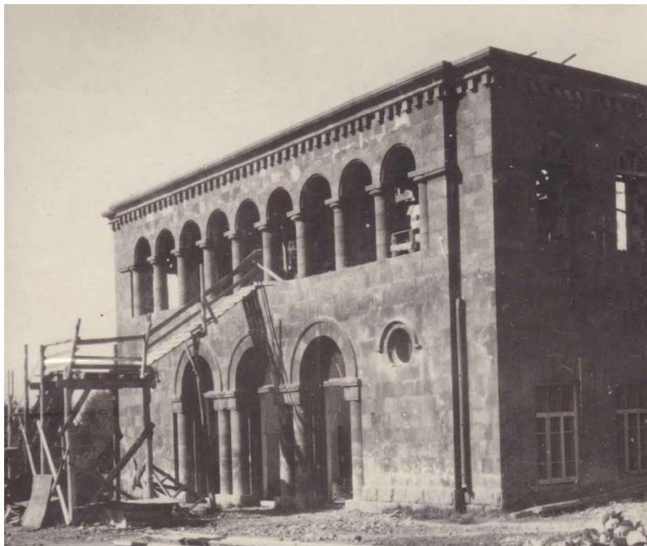
Նկ. 1 – Ակումբ Ներքին Դվինում (այժմ՝ Դվին), 1936 թ. (ճարտ.՝ Տ. Մարության)