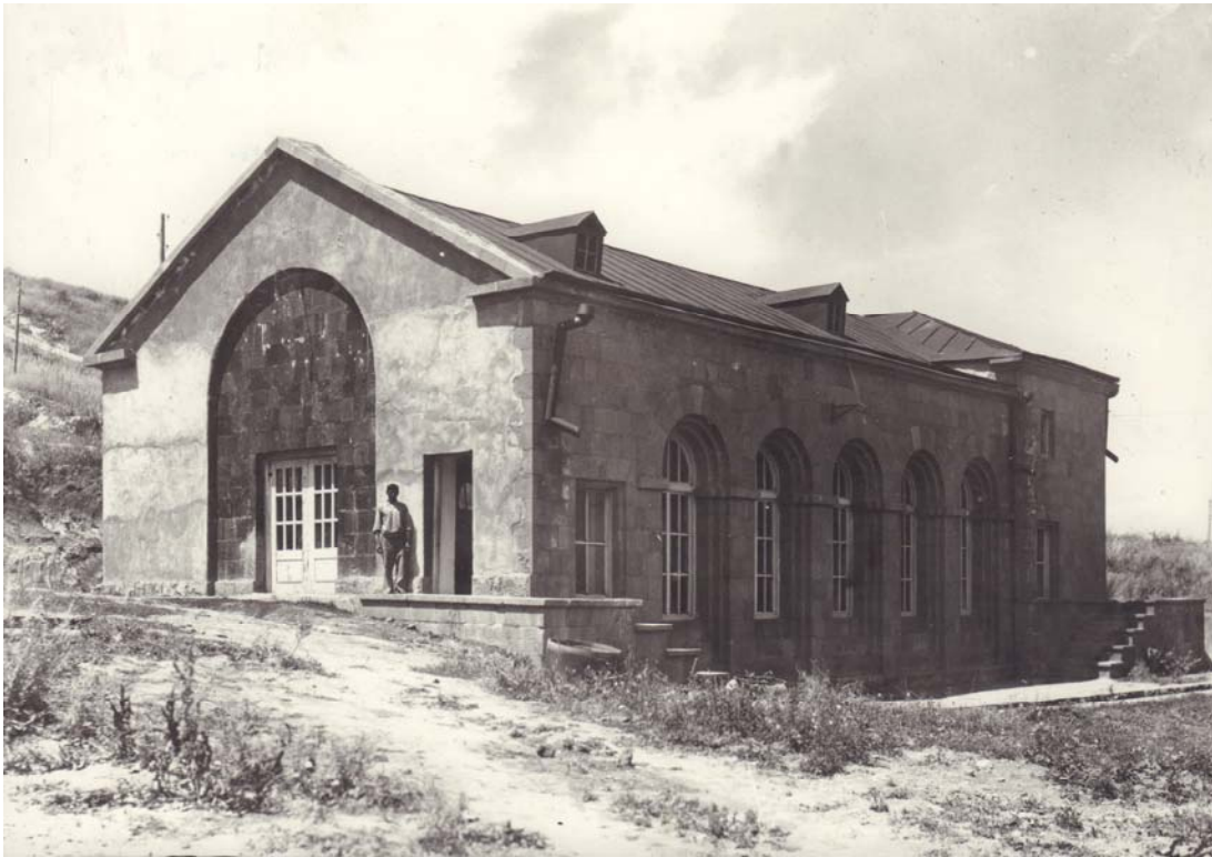
Նկ. 4 – Մարտունի ՀԷԿ, 1936 թ. (ճարտ.՝ Ս. Մարության)