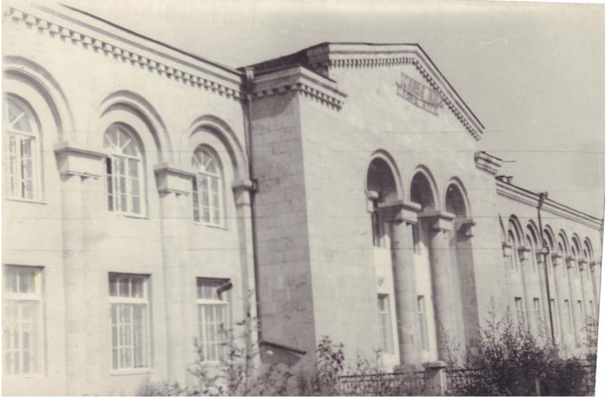
Նկ. 3 – Ստեփանավանի գոռվետ տեխնիկումի շենքը (ճարտ.՝ Ս. Մարության)