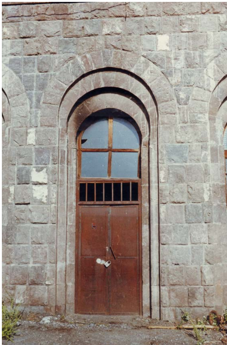
Նկ. 5 – Նոր Բայազետի (այժմ՝ Գավառ) ՀԷԿ-ի պատուհանի բարավորների մոտիվը, 1940 թ. (ճարտ.՝ Տ. Մարության):

1940 թվականից աշխատանքի անցնելով Թբիլիզիի Երևանի բյուրոյում, սկսեցի մշակել Գյումուշ հէկ-ի գլխավոր շէնքի ճարտարապետական նախագիծը, դրանում էլ մշակեցի պատուհանների բացվածքների կիսակլոր, աստիճանաբար լայնացող բարավորների մոտիվը: Կիսաշրջագծերի կենտրոնների բարձրացնելու ճիշտ չափը գտնելու նպատակով, առաջին փորձը կիրառեցի Նոր Բայազետի փոքր հէկ-ի [նկ. 5] նախագծում, արդյունքը տեղափոխեցի Գյումուշ հէկ [նկ. 6]: Ճարտարապետական այս մոտիվը ևս մինչ իմ հորինելը ոչ ոքի կողմից չէր կիրառվել: